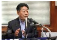
公明党の北側一雄副代表

公明党の北側一雄副代表は29日、NHKの討論番組で、日本を攻撃しようとする外国のミサイル基地などをたたき「敵基地攻撃能力」について、「打撃力を米国だけに依存しているのか。（日本が『矛』の能力を保持しないでもいいのか問われている）」と述べ、議論が必要との認識を示した。