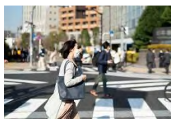
写真はイメージ=ゲッティ

毎日新聞と社会調査研究センターが23日に実施した全国世論調査では、新型コロナウイルスの感染拡大についても質問した。今後の流行が懸念されている「第7波」について、「不安だ」との回答は33%にとどまり、「不安だが以前ほどではない」が50%を占めた。「不安は感じない」も17%あった。