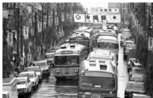
1972年5月15日、復帰を祝う横