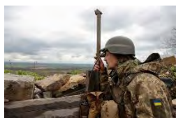
ロシア軍による攻撃が続くウクライナ東部ドネツク州で、潜望鏡を使って前線を観察するウクライナ軍の兵士=22日

毎日新聞と社会調査研究センターは23日、全国世論調査を実施した。ロシアが侵攻したウクライナからの避難民を日本政府が受け入れたことについて聞いたところ、「もっと多くの避難民を受け入れるべきだ」との回答は69%で、「これ以上受け入れる必要はない」の14%を大幅に上回った。「わからない」は17%だった。