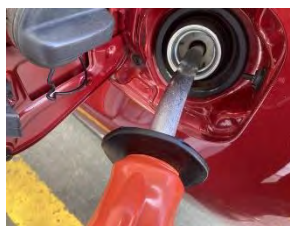
ガソリンの給油=東京都内で 2022