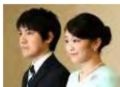
眞子さまと小室圭さん＝2017年9月3日