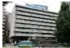
自由民主党本部＝東京・永田町

自民党総裁選について、時事通信は党所属国会議員の支持動向を調査した。それによると、河野太郎規制改革担当相（58）と岸田文雄前政調会長（64）が競り合い、高市早苗前総務相（60）が激しく追っている。出遅れた野田聖子幹事長代行（61）は挽回に懸命。ただ、2割程度が態度を決めておらず、党员・党友票の行方を含め、情勢は流動的だ。