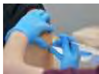
新型コロナウイルスのワクチン接種

毎日新聞と社会調査研究センターが18日に実施した全国世論調査で、新型コロナウイルス対応やワクチンの接種についても聞いた。緊急事態宣言発令中の行動制限を、ワクチン接種が進んだ段階で緩和する方針を政府が示したことについては、「妥当だ」との回答が49%で、「緩和すべきではない」の34%を上回った。「もっと早く緩和すべきだ」は9%、「わからない」は7%だった。政府は現在、宣言対象地域では、飲食店に時短営業や酒類提供の停止を要請している。