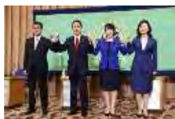
自民党総裁選立候補者討論会を前に記

念撮影に応じる(左から)河野太郎行政改革担当相、岸田文雄前政調会長、高市早苗前総務相、野田聖子幹事長代行＝東京都千代田区の日本記者クラブで2021年9月18日午後1時56分