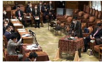
衆院内閣委員会で立憲民主党の

玄葉光一郎氏（手前左）の質問に答える西村康稔経済再生担当相（同中央右）。同右端は河野太郎行政改革担当相＝国会内で2021年7月28日午後1時42分、竹内幹撮影