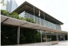
首相官邸（東京都千代田区）

政府が安全保障上重要な産業や技術への監督を強化するため、「経済安全保障一括法」の制定に向け調整に入ったことが27日、分かった。外国資本による国内企業への出資を規制する外為法を軸に、放送、航空など個別業種に関連する法律の外資対応などを集約する。半導体をはじめとする戦略4品目の供給網（サプライチェーン）強化策なども盛り込む方針。来年の通常国会への法案提出を目指す。