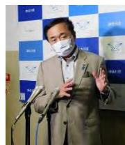
記者団の取材に応じる神奈川県黒岩祐治知事