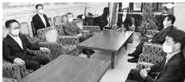
(写真) 会談する野党国対委員長ら