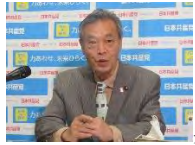
共産党の穀田恵二氏＝2021年6月30日撮影

「全体主義発言への報復で候補擁立」説を否定 共産・穀田氏 毎日新聞 2021/7/29 06:00 (最終更新 7/29 07:08)