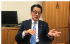
立憲民主党の岡田克也氏

立憲民主党の岡田克也元副総理は29日、来年夏の参院選に向けて立民、国民民主両党は合流を目指すべきだとの考えを示した。「参院選まで1年を切っている。またばらばらという訳にはいかない。両党執行部は大局観を持って正しい判断をしてもらいたい」と述べた。