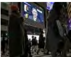
菅義偉首相の会見の様子を映すJR新宿