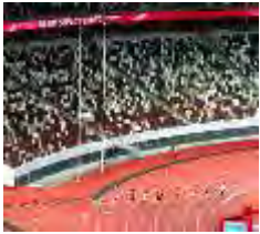
無観客の国立競技場で開かれた陸上のテ