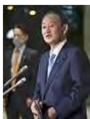
記者団の質問に答える菅首相（1日午後、首相官邸で）

読売新聞社が2～4日に実施した全国世論調査で、菅首相にどのくらい首相を続けてほしいかを聞くと、「今年9月の自民党の総裁任期まで」47%がトップで、「1、2年くらい」23%、