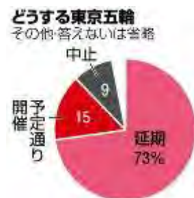
東京都民に聞いた。どうする東京五輪