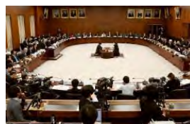
開かれた衆院憲法審査会＝14日午前 衆院憲法審査会は14日午前、9月に欧州4カ国を訪れた与野