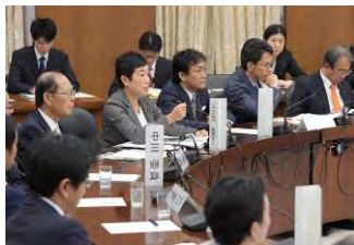
衆院憲法審査会で自由討議をする

毎日新聞 2019年11月14日 19時18分(最終更新 11月14日 19時18分)