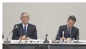
関西電力の会見(10月2日)

関西電力の10月2日の会見でも、地元の有力者として最大限の配慮をしていたことを指摘しています。