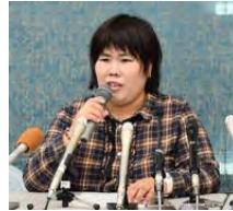
検察側の有罪立証断念を受け、記者会見で無

元看護助手、再審無罪確定へ＝検察側、有罪立証断念＝大津地裁 時事通信 2019年10月23日 12時22分