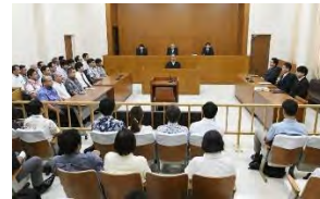
沖縄県の埋め立て承認撤回を取り消す裁決に国交相が関与したのは違法だとして、県が裁決取り消しを求めた訴訟の判決が言い渡された福岡高裁那覇支部の法廷＝23日午後

県は昨年8月、埋め立て承認を撤回。防衛省沖縄防衛局が10月、行政不服審査法に基づく審査請求などを申し立て、石井啓一国交相（当時）が今年4月、撤回を取り消す裁決をした。