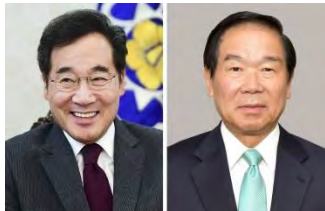
韓国の李洛淵首相（左）、日韓議員

2019/10/23 12:11 (JST)10/23 12:16 (JST)updated