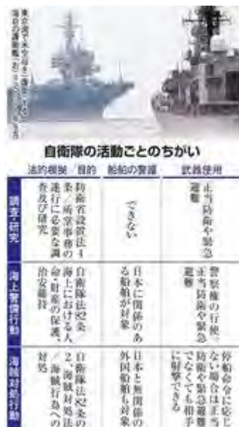
自衛隊の活動ごとのちがい

政府は、ホルムズ海峡周辺を含めた、中東への自衛隊派遣の検討に入った。「調査・研究」名目で情報収集をするための派遣だが、根拠となる防衛省設置法の条文は解釈の幅が広く、過去にも「調査・研究」名目での派遣が批判を浴びたことがある。早ければ来年1月の派遣が見込まれる中、現場には戸惑いも広がっている。