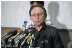
辺野古訴訟敗訴を受け、記者団の取材に応じる玉城デニー沖縄県知事＝23日午後、那覇市

米軍普天間飛行場（沖縄県宜野湾市）の名護市辺野古移設をめぐり、県が国を相手取り、国土交通相が裁決で取り消した「埋め立て承認撤回」の効力回復を求めた訴訟の判決が23日、福岡高裁那覇支部であった。大久保正道裁判長は「訴訟の対象になり得ない」と述べ、県の訴えを却下した。