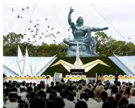
「長崎原爆の日」の平和祈念式典＝8月