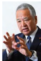
自民党の甘利選対委員長＝東京都千代田区で 2019年3月19日

毎日新聞 2019年5月16日 20時20分(最終更新 5月16日 20時48分)