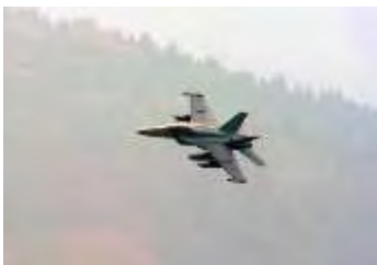
大豊町の上を低空で飛行する米