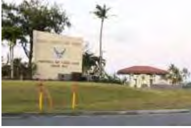
米領グアムのアンダーセン