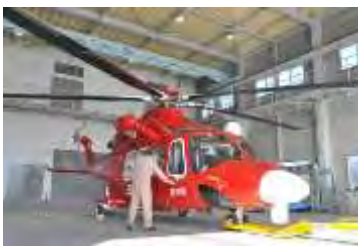
災害救助などで出動する県消