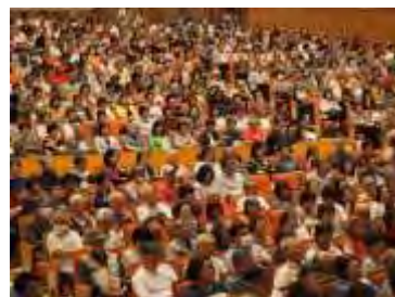
憲法講演会で登壇者の対談に