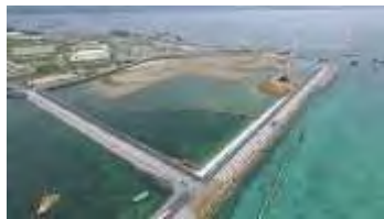
埋め立てが進む名護市辺野古の

【平安名純代・米国特約記者】米海兵隊の基本戦略を示す年次報告書「2019年航空計画」から名護市辺野古の新基地建設計画が削除されている件について、米海兵隊本部(米バージニア州)は1日までに本紙の取材に「計画を削除したわけではなく、計画の変更を示すものでもない」と説明した。削除した理由や、変更が新基地建設計画の遅れを反映したものかどうかに関する質問には回答しなかった。