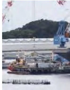
クレーンを使って空母から運搬船に