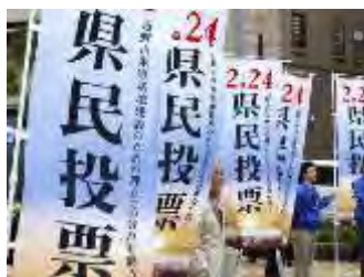
沖縄県民投票の告示日に那覇市内に掲げられたのぼり旗＝14日

共同通信社は16、17両日、米軍普天間飛行場（沖縄県宜野湾市）の名護市辺野古移設をめぐる県民投票について県内で電話