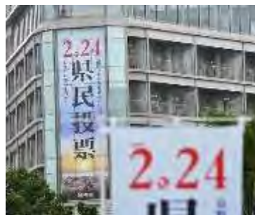
県民投票（イメージ写真、記事と写真に直接関係はありません）