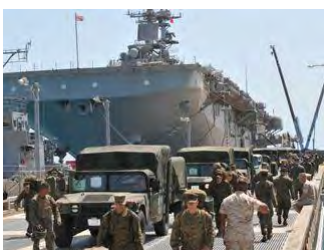
東日本大震災の被災地

支援を終え、強襲揚陸艦エセックス(後方)から降り立つ米海兵隊員=2011年4月12日、うま市・ホワイトビーチ