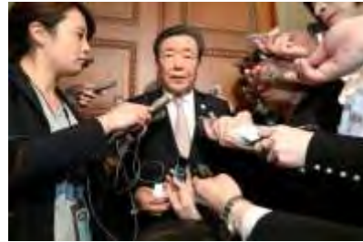
西村康稔官房副長官から

「森友文書」書き換え問題に関する説明を受けた後、取材に応じる自民党の森山裕国対委員長＝12日午前10時31分、国会内