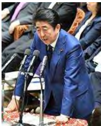
安倍晋三首相＝国会・衆院第1