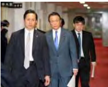
取材に応じるため大臣室

当時の佐川宣寿・財務省理財局長は国会で事前の価格交渉を否定するなどしていた。こうした答弁と整合性を取るために書き換えた、との説明だ。麻生氏はまた、書き換えの背景に政治家への「付度（そんたく）」があったかとの質問には、「考えていません」と否定した。