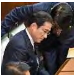
衆院本会議に臨む自民党の岸田文雄